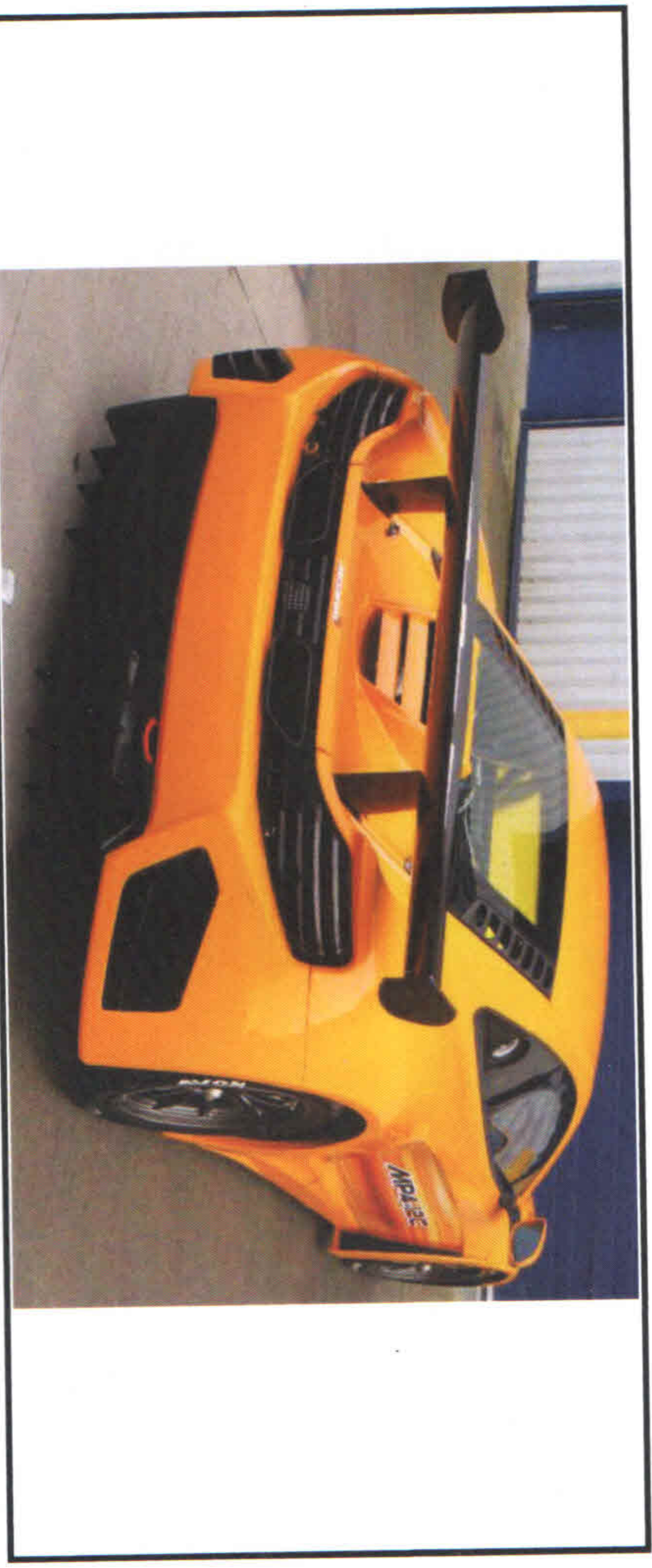
Voiture vue de 3/4 arrière / Car seen from 3/4 rear

Numéro de série type Typical series number